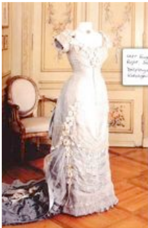
1877 - 1878 Dress Right - 1878 Dress Delivered at Hotel von Königsplatz, Berlin, 1878